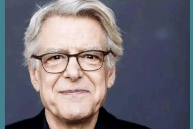
Georges Aperghis, Sidérations , création 2026, extrait

“ la femme se dresse tour de magie sa gorge pimpante fière d'elle à faire surface déjà de face jamais de fin incrédule se déplie sans hésiter ses ongles à elle inépuisable déjà livide dressée un instant jusqu'au point mort en sens inverse vivement mon souffle ”